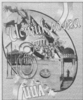
(Давоми. Бошланғичи 1-бетда).

Муддати ўтган қарздорликнинг салмоқли қисми Олмалик, Ангрэн, Бекобод, Чирчиқ шаҳарлари, Оҳангарон, Қирай, Ўрта-чирчиқ, Зангиота, Янгийўл туманлари ҳиссасига тўғри келса, Паркент ва Пискент туманларида муддати ўтган қарздорликлар бар-тароф қилинди.