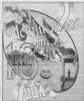
(Давоми. Бошланishi 1-бегда).

Кучли ижтимоий сийёсат жамиятда барқарор ривожланиши таъминлашининг асосий тамойилларидан биридир. Давлатимиз бу масалага катта эътибор бериб келмоқда. Кейинги йилларда прокуратура органлари томонидан аҳолининг ижтимоий ҳимоясига доир қонулар ижроси бўйича назорат ишлари кучайтирилди. Мазкур йўналишда 23 та текшириш ишлари ўтказилди. 370 минг сўмлик зарар ихтиёрий ундирилди, фуқаролик судларига 55 млн. сўмлик 164 та даъво аризалари киритилди.