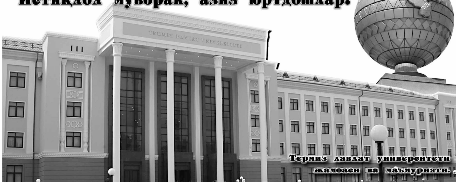
Термиз давлат университети жамоаси ва маъмурияти.