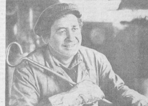
«Узбексельмаш» ишлаб чиқариш бирлашмасининг коллектив ўтган йили давлат планини муваффақиятли адо этиб социалистик мажбуриятларини бажарди. Бирлашма коллектив меҳнатдаги муваффақиятлари учун Ўзбекистон Компартияси Марказий Комитети, Ўзбекистон ССР Министрлар Совети, Ўзбекистон Касаба Союзлари республика Совети ва Ўзбекистон КПСС Марказий Комитетининг кўмаки билан мукофотланди.

Шаҳар индустрияси шу йилнинг январь-февраль ойлари мобайнида мамлакат ҳалқ хўжалигига планга қўшимча 39 километр шланг, 30 километр сим, 3 компрессор, 19 йигирув машинаси, икки электор кўрик краани, 18 тахта териш комбайни, 64 тонна қоғоз, 26 минг трикотаж буюмлари, 8 минг жуфт чуқун-пайпоқ буюмлар, 35 минг жуфт лавабал, 2280 тонна омухта ем, 126 тонна макарон маҳсулотлари, 11 тонна ўсимлик ёғи, 182 тонна маргарин етказиб бердилар.