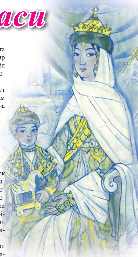
Отам бу остоннинг хокбези, Онам ҳам бу саро бўстон канизи...

Бу буюк аёл ҳақида ҳам маълумотлар жуда кам. Бу улуғ аёлнинг исмлари ҳақида ҳам аниқ маълумотлар сақланиб қолмаган. Айрим тадқиқотчиларнинг маълумотига кўра, исми Ҳалимабону (ёки Салимабону) бўлиб, амирзода шайх Абу Саид Чангийнинг қизи бўлган. Ҳазрат Навоий “Мажолисун-нафоис”да тоғаларининг ҳам таъби назми борлиги, туркий ва форсийда ижод қилганини ёзади. Шундан билиш мумкин бу аёл ҳам жуда маърифатли, саводхон бўлган. Тахминан, 1436-37 йилларда Ғиёсиддин Баҳодур билан турмуш қурган. Ҳазрат Навоийдан ташқари Дарвишалибек ва Бахлулбек исмли ўғиллари бўлган. Ҳазрат Навоий “Бадоеъул-бидоя” девони муқаддимасида темурийлар хонадони хусусида тўхталиб, ёзади: