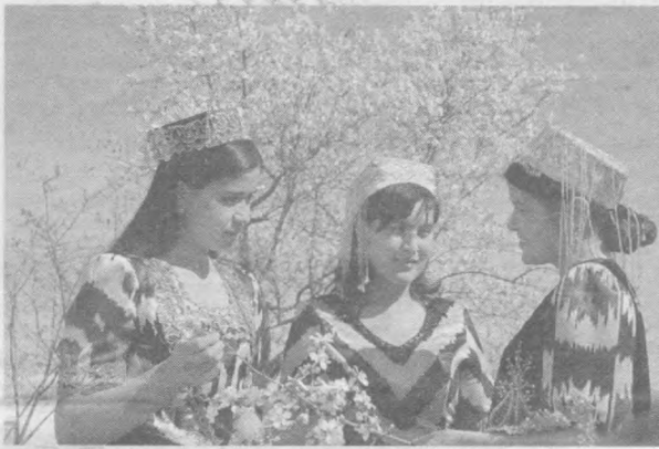
Баҳор бизга ўхшайди...

Навоий вилоят прокуратурининг биринчи ўринбосари