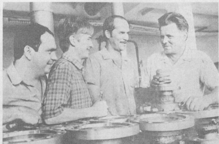
«Средгазавтоматика» ишлаб чиқариш бирлашмасининг коллектив КПСС XXVII съезди шарафига бошланган зарбдор ўн куликларнинг саккизинчи ўн кулигида фидокорона меҳнат қилиб, ўтган ўн куликларда кўнра қирғилган юртдаликларнинг ишларида