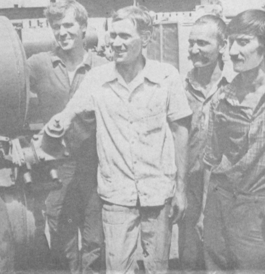
КПССнинг навбатдаги XXVII съезди шарафига бошланган социалистик мусобақада «Компрессор» заводининг ишчи-хизматчилари фаол иштирок эттишмоқда. Бу ерда янги техникавий талабларга жавоб берадиган компрессорлар ишлаб чиқариш борасида бир қатор изланишлар олиб борилля-пти.