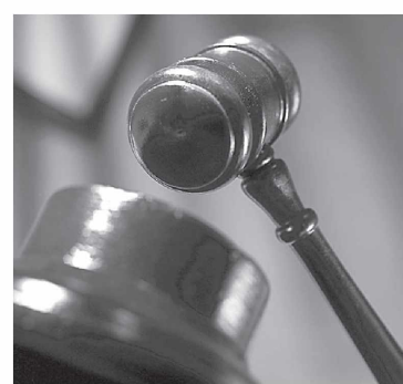
ланувчига етказилган моддий ва маънавий зарарни тўлиқ қоплаган. Шунинг учун мазкур жиноят иши ҳаракатдан тугатилди.

Бекобод туманида яшовчи М.Шербеков фуқаро И.Қосимовни уриб тан жароҳати етказган. Ишдаги тўплаган далиллар ва судда аниқланган ҳолатларга қўра, айбланувчи М.Шербеков ўзига қўйилган айбга тўлиқ иқроор бўлиб, жабрланувчи И.Қосимов билан дастлабки тергов даврида ярашган, жабрланувчи ихтиёрий равишда давводан воз кечган. Айбланувчи жабр-