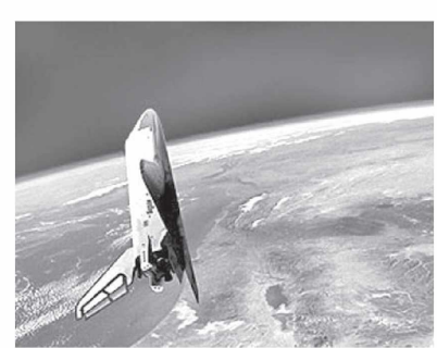
космик станцияга сайёҳлар жўнатишда «Роскосмос» билан яқиндан ҳамкорлик қилиб келаётган «Space Adventures» компанияси танлайди ва жўнатади.

Мухандисларнинг фикрича, биринчи гада космик меҳмонхона 4 та қатъдан иборат бўлади. Унда яшаш учун 7 киши Ердан ракетада парвоз қилиши мумкин. Сайёҳларни орбитага олиб чиқиш ва коинотдан Ерга олиб тушиш Россиянинг «Союз» космик кемаси ёрдамида амалга оширилади. Самовий меҳмонхона сайёҳлари истеъмоли учун озик-овқат маҳсулотлари эса «Прогресс» юк кемасида коинотга олиб чиқилади.