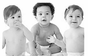
Маълумки, Қўшма Штатларда ҳар 5 йилда аҳолини умумий рўйхатга олиш тадбирлари ўтказилади. Ундан кўзланган асосий мақсад парламент куйи палатасида алоҳида штатлар вакиллари адолатли тақсимлашни таъминлашдир. Аҳолини рўйхатга олишда АҚШда яшаётган барча фуқаролар, жумладан, Америка фуқаролигини ҳали олмаган шахслар ҳам ҳисобга олинади. Улар ҳақидаги маълумотлар махфийлиги қатъий таъминланади.

Статистика маълумотлар шундан далолат бермоқдаки, мамлакатнинг 50 та штатидан 15 тасида, жумладан, Массачусетс, Канзас, Огайо, Калифорния ва бошқа штатларда оқ танли америкаликлар сони анчага камайганлиги кузатишмоқда. 10 та штатда эса аксинча — 10 фоизга ортганлиги қайд этилган. Умуман, ҳозир оқ танли америкаликлар мамлакат аҳолисининг 64 фоизини ташкил этмоқда. Ўн йил олдин бу кўрсаткич 69 фоизга тенг эди. Қора танли америкаликлар сони эса 12 фоизга ортган ва бугунги кунда улар умумий аҳолининг деярли 13 фоизига яқинлашиб қолди. Бу ўсиш асосан келиб чиқиси Лотин Америкаси ва Осиёдан бўлган халқлар ҳисобига ортмоқда.