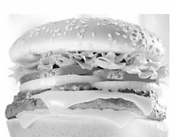
ри сингари озиқ-овқат маҳсулотлари ва алкоғолсиз ичимликлар тарихидаги шакар миқдори учун ҳам қўшимча солиққа тортиш амалиёти қўлланиб келинади. Қўшимча солиққа тортиш эса ўз навбатида ёғ ва гўшти ярим фабрикатлар нархи баланда бўлишини таъминлайди. Бу эса уларни қамроқ ишлатишга ундайди.

алоҳида солиқ солинади Дания ҳукумати мамлакат аҳолисининг соғлигини муҳофаза қилиш ва умрини узайтириш мақсадида ёғли озиқ-овқатларга алоҳида солиқ солиш тартибини жорий этди.