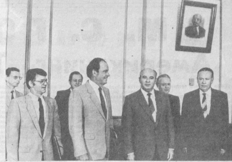
Суратда: учрашув пайти. В. Мاستюков ва В. Соболев фотоси. (ТАСС).

КПСС XXVII СЪЕЗДИНИ МУНОСИБ СОВҒАЛАР БИЛАН КУТИБ ОЛАЙЛИК!