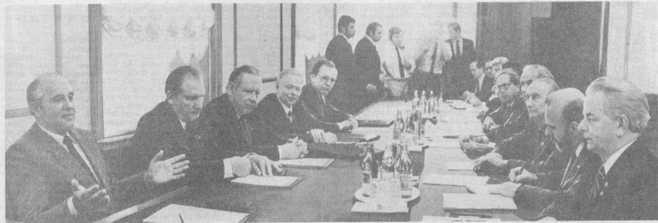
Суратда: суҳбат пайти.

Ўзбекистон Компартияси Тошкент Шаҳар Комитети ва Тошкент Шаҳар Советининг органи