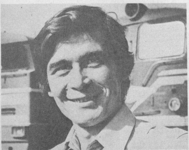
ПУЛАТ ИЗ ШУҲҚОРЛАРИ

Тошкент тепловоз депосининг коллективни юк ва пассажирлар ташиш топшириқларини мунтазам ортиги билан адо этиб келмоқда. Бунда «КПСС XXVII съезди» зарбдор ўн кунлик» шорни ости-