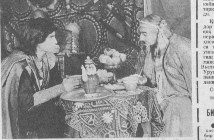
«Минг бир кеча» яна экранда

гиз бўйларида, Каспий денгизининг ғарбий зоналарида ҳам бундай туПРОҚ учраб туради. Шуниси диққатга сазовор асосан субтропик иқлим ўлкаларида, катта дархатли ўрмонларда, баланд тоғларнинг қия бағриларида учрайди. Унинг қизиллигига сабаб, бу туПРОҚНИНГ таркибидо қизил оксидлари кўп бўлишидир. Чўчки иссиқ ва наам иқлим тоғ жинсларини бетўхтов нураши, алюминий силликатларининг эриши, калций ва магнийнинг пайдо бўлиши каби ҳодисалар туПРОҚ таркибига таъсир этган. Қизил туПРОҚ донатор ва майда қовушқор ҳолда бўлади. Минерал зарралари бой ҳисобланади. Айнақча темир оксидлари унга сарғиш ёки қизил ранга берди. Унинг мақони асосан Хитой, Вьетнам, Япония, АКШ, Уругвай, Италия, Испания ва Европа мамлакатларидир. СССРнинг Қора ден-