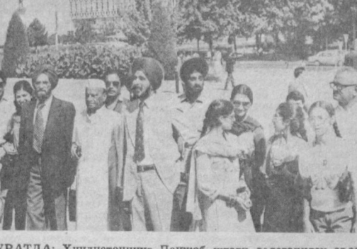
СУРАТДА: Ҳиндистоннинг Панкоб штати делегацияси аъзолари Тошкент билан танишмоқдалар.

ри ҳам «олтин куз» фестивалида қатнашадилар.