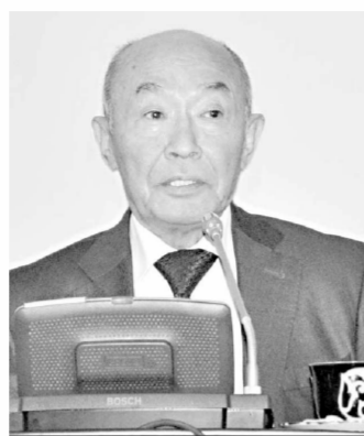
Абдулла ОРИПОВ, Ўзбекистон Қаҳрамони, Халқ шоири:

Бундан ташқари, «Мамлакатимизда демократик ислохотларни янада чуқурлаштириш ва фуқаролик жамиятини ривожлантириш концепцияси» асосида ишлаб чиқилган ва 2011-2014 йилларга мўлжалланган Ҳаракат дастурини изчил бажариш бўйича партиямиз фракцияси аъзолари, маҳаллий Кенгашлардаги депутатлик гуруҳлари ҳамкорлиги талаб даражасида деб бўлмапти. Агар бу борада ҳамкорлиқни самарали йўлга қўйсак, худудлардаги ижтимоий-иқтисодий масалалардан чуқур хабардор бўлаемиз. Бу эса фаолиятимиз самарадорлигини оширади.