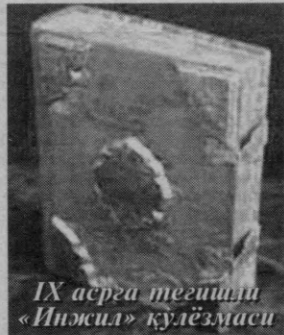
IX асрга тегишли «Инжил» қўлёзмаси

Хориж матбуоти хабарлари асосида Жаҳонгир МАХСУМОВ тайёрлади