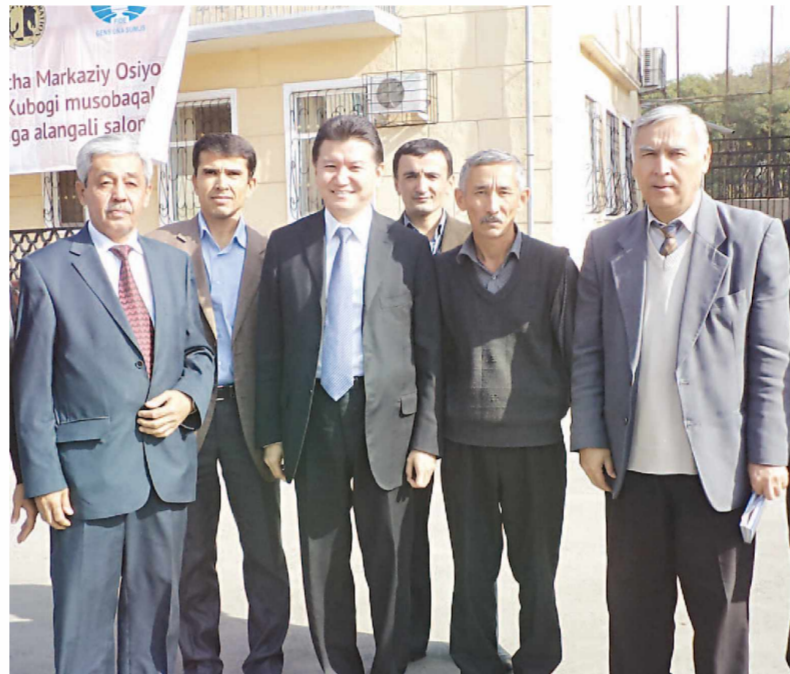
1-Марказий Осиё (Ўзбекистон) кубогига қатнашган рақиблар билан бирга ФИДЕ президенти Кирсан Илюмжиров.

Пойтахтимизда Халқаро шохмот федерацияси (FIDE) тасарруфида ўтказилган 1-Марказий Осиё кубогига ҳамюртимиз, 17-жаҳон чемпиони Рустам Қосимжоновнинг ғалаба қозонганидан хабардорсиз. Ушбу мусобақада FIDE президенти Кирсан ИЛЮМЖИНОВ иштирок этди ва матбуот ходимларига интервью берди.