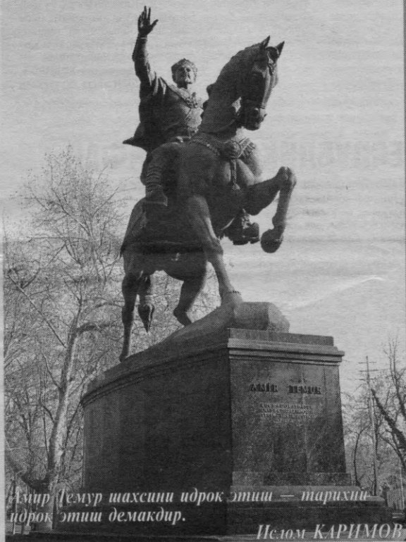
Амир Тему́р шахсини идрок этиш — тарихий идрок этиш демакдир.