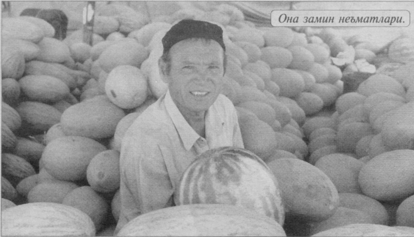
Она замин неъматлари.