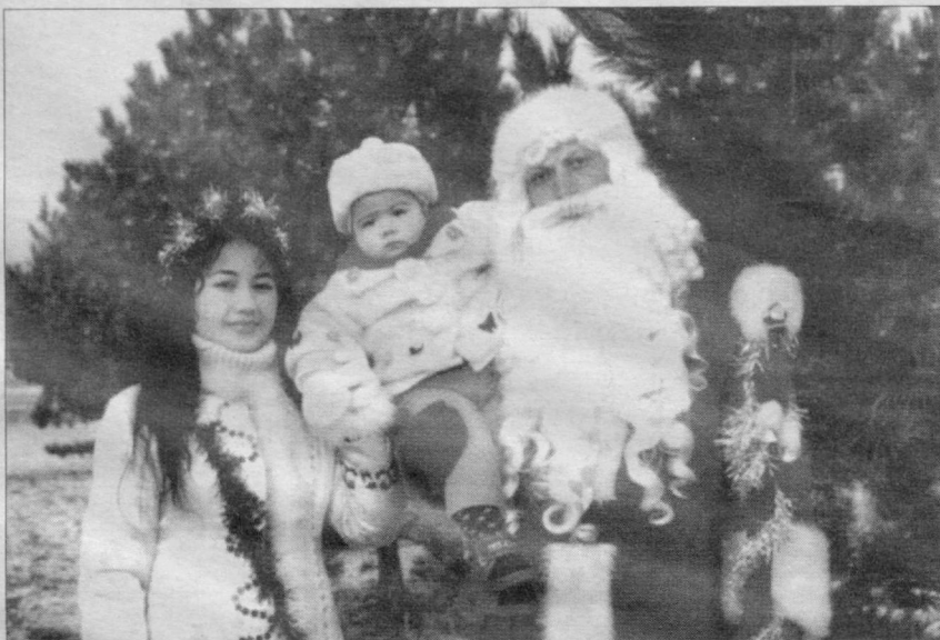
Қорбобо ва қорқизнинг ташрифи болажонлар қувончига янада қувонч қўшиб, уларни эртақлар оламига етаклади.

Ислом КАРИМОВ, Ўзбекистон Республикаси Президенти.