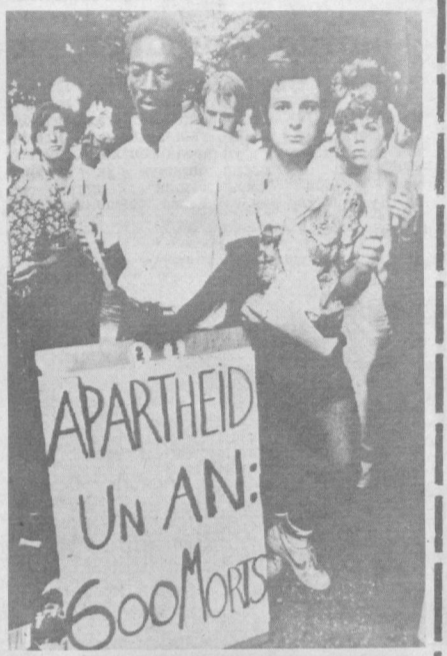
Франция. Мамлакатда Жанубий Африка ирқчиларининг олиб бораётган сиёсати қарши норозилик митинглари тез-тез бўлиб турибди. Суратда: Парижда ўтказилган норозилик митинги қатнашчилари.