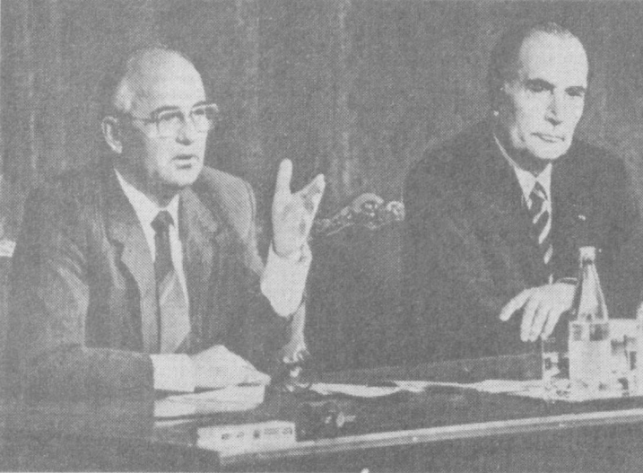
М. С. Горбачев ва Ф. Миттераннинг матбуот конференцияси.

М. С. Горбачев билан Ж. Марше ўртоқлар В. И. Лениннинг кабинет хонасидан балконга чиқдилар. Париж меҳнаткашларининг вакил-