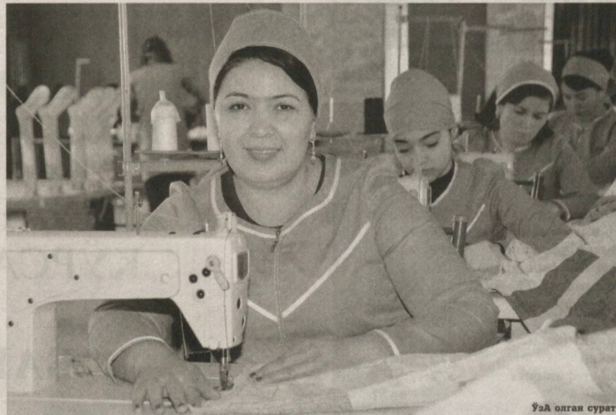
Ўял олган сурат

2016 йил I ярим йиллиги давомида банк фаолиятининг асосий даромад манбаи ҳисобланган банк активлари хажми, таркиби ва даромадлигини оширишга алоҳида эътибор қаратилди. Бунда миждозлар билан яқиндан ҳамкорлик қилиш ўз натижасини бериб, банкнинг кредит қўйилмалари 2016 йил I январга нисбатан 619,8 миллиард сўмга ошиб, 2016 йилнинг 30 июнь ҳолатига 4258,6 миллиард сўмни ташкил этди.