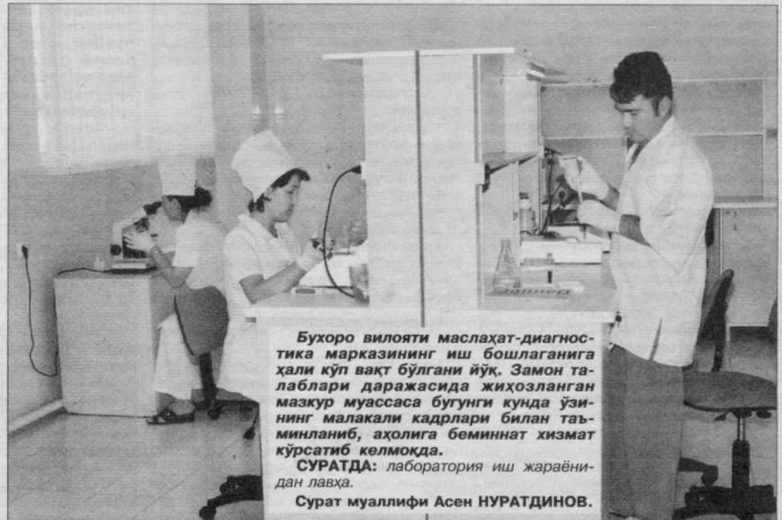
Бухоро вилояти маслаҳат-диагностика марказининг иш бошлаганига ҳали кўп вақт бўлгани йўқ. Замон талаблари даражасида жиҳозланган мазкур муассаса бугунги кунда ўзининг малакали кадрлари билан таъминланиб, аҳолига беминнат хизмат кўрсатиб келмоқда.

Тахририят юқоридаги фикрлардан хулоса қилган ҳолда тиббиётнинг долзарб мавзуларини, янгилик ва изланишларни, шунингдек, тиббиёт ходимлари фаолиятини газета саҳифаларида мунтазам чоп этиб боришда имкон қадар ҳаракат қилади. Ва шу ўринда Сиз ҳам ўзингизга ҳамиша таянч бўлиб хизмат қиладиган сеvimли нашрингизга обуна бўлсангиз, фойдадан холи бўлмас эди.