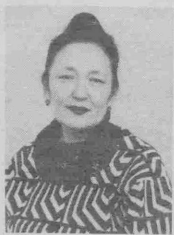
Хурмати халқовимиз МҶРҶВ-ЛАЙХОН!

Сизни 7 феврал — тугидан кунингизнинг 50 йиллиги билан чин юракдан табриқлаймиз. Сизга узоқ умр, соғлиқ-саломатлик, оилангизга бахт тилаймиз. Фарзандларингиз ва сеvimли неварангиз Баҳодиржоннинг бахтига доим омон бўлишингизни яратган Аллоҳдан сураб қоламиз.