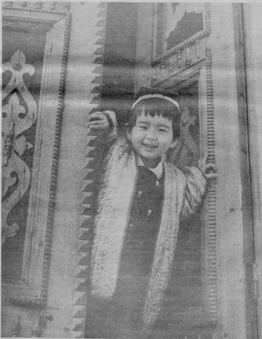
Бу дунё хуш офтобларга тўлиб кетар Кулганида ўзбегимнинг болалари.