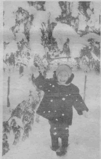
— Қорбўрон ўйнаймизми?