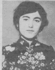
Меҳрибон ва сеvimли онажонимиз ОЗОДАХОНИ!

Тошкент шаҳар «Матбуот тарқатиш уюшмаси» АЖ жамоаси