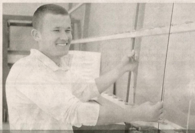
Жиззах шаҳридаги “Ҳақиқат Отабек” кичик корхонаси ойнага қайта ишлов беришга ихтисослашган.

“Ипотека-банк”нинг ҳудуддаги бўлими молиявий кўмағида фаолият бошлаган мазкур корхона маҳсулотлари вилоятдаги мебель ишлаб чиқарувчи корхоналар ҳамда қурилиш фирмаларига етказиб берилмоқда.