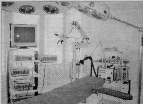
СУРАТЛАРДА: Республика ихтисослаштирилган урология маркази Урганч филиалининг ташқи ва ички кўринишидан лавҳалар.

ни тайёрлаш борасидаги ишларни изчил кўчайтириш лозимлигини алоҳида таъкидлади.