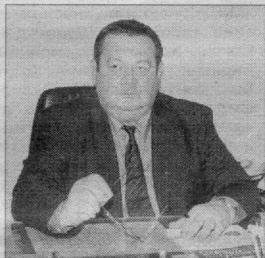
Ф. НАЗИРОВ, Министр здравоохранения Республики Узбекистан.

Действительно, X Форум стран ЦАР по охране здоровья матери и ребенка стал большим событием в жизни не только нашей страны, но и в жизни всех Центрально – Азиатских Республик. Здоровые дети это наша радость, уверенность в завтрашнем дне, это гарант построения большого будущего.