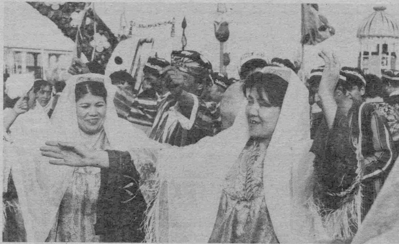
Наврўз шодиёналари давом этмоқда.