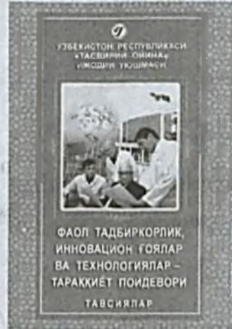
ФАОЛ ТАДБИРКОРЛИК, ИННОВАЦИОН ТУЯЛАР ВА ТЕХНОЛОГИЯЛАР — ТАРАККИЕТ ПОЙДЕВОРИ ТАСВИЙЛАР

Шавката Мирзиёева на мероприятиях международного и республиканского уровня, встречах с представителями разных сфер, — говорит председатель творческого союза Исфаидиёр Латипов. — Также в методичке уделяется внимание таким вопросам, как воспитание физически и духовно развитого поколения, важность коренного реформирования медицинской сферы, обеспечение верховенства закона и