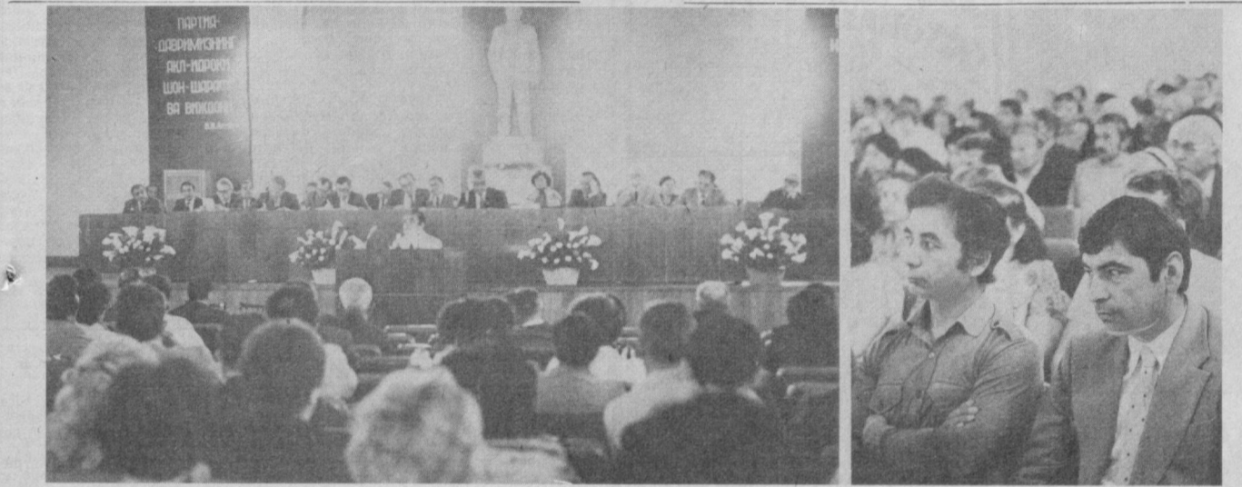
31 май, 1983 йил. Ўзбекистон ССР Фанлар академиясининг Тошкентнинг 2000 йиллигига бағишланган илмий сессияси мажлиси ўтмоқда.

Мамлакатимизнинг йirik шаҳарларидан бири бўлган Тошкент сентябрь ойида ўзининг 2000 йиллик тўйини нишонлайди. Бу юбилей катта илмий жиҳатдангина эмас, балки ижтимоий-сиёсий жиҳатдан ҳам муҳим аҳамият касб этади. Тошкент меҳнатқашлари ўзларининг жоножон шаҳри юбилей санасини КПСС XXVI съезди, Ўзбекистон Компартияси XX съезди қарорларини ҳаётга тадбиқ этиш борасида янгидан-янгй ўқушлар билан кутиб олмақдалар.