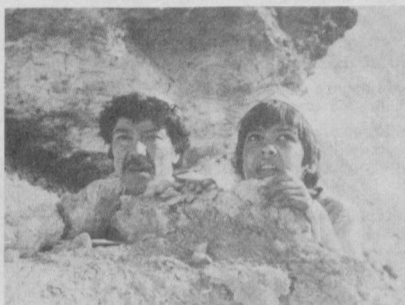
СУРАТЛАРДА: XVI Бутуниттифоқ кинофестивали совринларига сазовор бўлган «Алло-маннинг ёшлари» ва «107-инструкция бўйича тўнтарин» (пасдаги сурат) фильмларидан кадрлар.