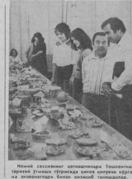
Илмий сессиянинг қатнашчилари Тошкентнинг тарихий ўтмиш туғриқсизда хўжалик қўриқлари кўргазма экспонатлари билан қизиқиб танишди.