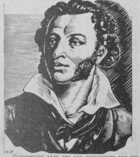
Пушкинча ҳали ҳеч ким соддаликни ҳам поэтик нафосатни ҳам ўзида мужассамлаштирган бундай энгил ва жонли тилда ёзмаган эди; ҳали ҳеч ким рус шеърига бунчалик аниқлик, таъсирчанлик ва гўзаллик бахш этолмаган эди. Н. Г. ЧЕРНИШЕВСКИЙ.

БУГУН ТОШКЕНТДА ПУШКИНХОНЛИК КУНЛАРИ БОШЛАНДИ