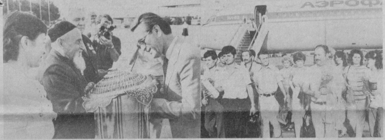
Тошкент. 5 июнь, 1983 йил. Македониялик маданият арбобларининг Тошкент аэропортида кутиб олинishi.