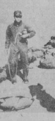
Рейган маъмурияти револуцион Никаргуа халқига қарши агрессия-ни давом эттирмоқда.

ПАРИЖ. Юқори Волта республикасида янги хукумат тuzили-ди, деб хабар бе-ради Франс Пресс агентлиги Уагадугу шаҳридан. Хукумат 18 кишидан иборат бўлди. Халқни қўқчашиш му-ваққат кенгашининг раиси давлат бошлиғи Жан-Батист Уадроуго миллий мудоффа ва собиқ фронтчилар иш-лари министри лавози-мини эгаллади. Илгари хукуматда бўлган-дех М. Кафандо ташки ишлар ва ҳам-корлик министри, Х. Тарнага ички ишлар ва хафсизлик минис-три қилиб тайинланди.