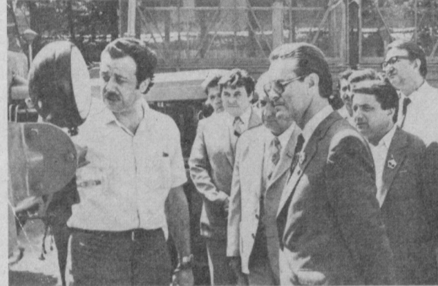
СУРАТДА: Македония делегацияси кент трактор заводида.