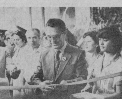
«Скопье» давми савдо корхоналаридан бири бўлиб қилини шубҳасиз.