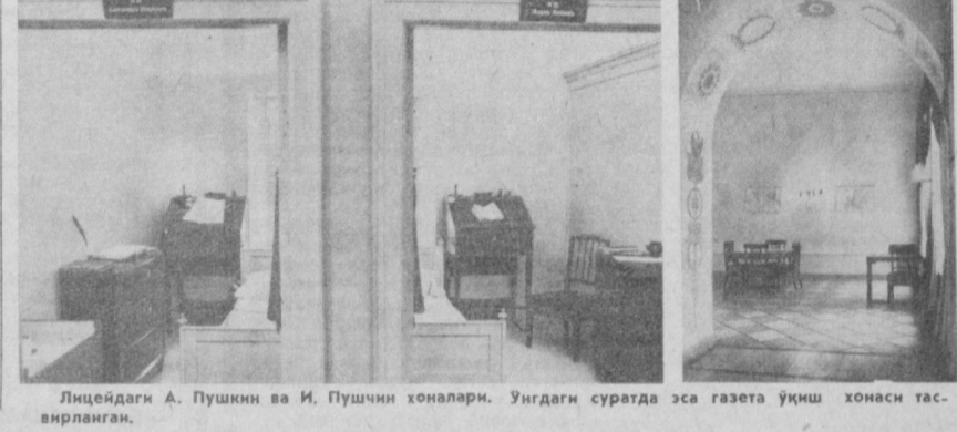
Лицейдаги А. Пушкин ва И. Пушкин хоналари. Ундаги суратда эса газета ўқиш хонаси тасвирланган.

да қадрли бўлган буюмлар, ашёлар мавжуд. Кўп ўтмай Москвада янги музей — «Пушкин квартираси» очилади. Арбат кўчасидаги 53-қадимий уй пойтахтда шоир яшаган ягона бинодир: У 1831 йил январдан майгача шу ерда турган. Ҳозир бинода таъмирлаш ишлари олиб бериляпти. Экспонатлар йилгилмоқда.