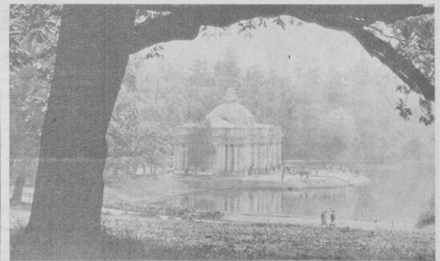
Ленинград атрофидаги боғларда ёзги мавсум очилди. Дам олиш кунларида юз минглаб кишилар табиат қучоғига йўл оладилар. Ана шундай яшилми ороғмоқлардан бири Буоқ рус шоирининг ижодий биографияси билан ўзвий боғлиқ бўлган Пушкин шаҳридир. Рус миллий маданиятининг дурдонаси бўлган Пушкин шаҳрига келганлар гўзал саройлар ва баҳаво боғларни кўриб бир олам завқ оладилар. СУРАТДА: Екатеринбург боғидаги «Гор» павильони

Менга етиб келар, эшитилар соз: У ҳайдар танбаллик уйқусини тез, Менда туғдирди меҳнатга гайрат, Ва сизнинг ижодий ҳайларингиз Қалб чуқурлиғида етилар қат-қат. Қўнғил хира мудқиш фикрдан лекни: Яншаган майсозлар ва тоғлар аро Инсоният дўсти пайқайди гағмин — Ҳар ёнда жоҳолат келтирган жарфо. Қўрмайин кўз ёшин, эшитмай фарёд, Одамлар бошига тушган кўрғулик, Вақтин хўжайинлик бунда—қонун ёт, Туйғусиз ўзига зўрлик билан мулк, Меҳнат ва деҳқонни тортиқлаб олган, Қанчиға бўйсуниб, бош солиб қўйи, Хўжайин ерида бир умр бўйи Оч кўллар энг оғир азобда қолган. Бунда то ўлғунча бўйинтуруқ бор, Гуррирамас қалбда орзу ва истак, Бунда бадкор ёвуз нафис-чун дилдор, Соҳибжамол қизлар ашнада гулдан, Кекайған оталар— орқа-пушталар, Навқирон ўғиллар, меҳнат, дўстлар, Жоанжон кўлбадан борар оломон Жафокаш кўлларининг ортинқиб олган, О, менинг овозим қалбга ҳаяжон Солосла кошқийди! Билмайман нафис Кўксимда ёнган ўт—алаганинги бу, Тақдир мени нотик яратмаган-ку! Шоҳ амри-ла, дўстлар, хору суз тутқун Халқини кўраманми овоз ва бардам, Ватаним устидо балқирми бир кун Маърифатли эркинни тоғторари ҳам!