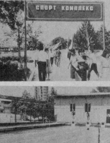
Спорт комплекси қурилиши Ўзбекистон Компартияси Марказий Комитети ва Ўзбекистон ССР Министрлар Советида Ф. Х. Норхўжаев хотирасини абадийлаштириш тўғрисида Ўзбекистон Компартияси Марказий Комитети билан Ўзбекистон ССР Министрлар Совети генерал-лейтенант Файзулла Хўжаевич Норхўжаевнинг номи беришга қарор қилинди. Ф. Х. Норхўжаев қабрида унинг бюсти ўрнатилди.

Тошкент халқ ҳўжалиги институтида янги студентлар спорткомплексини тавтанали очиб маросим бўлди. Ҳақиқий спорт байрамига айланган бу тантаналардан кейин институт, шаҳар, республикадаги янги янги ақробатчилар, гимнастикачилар, курашчилар, боксчилар, сымбоччилар, миллий кураш усталари ўз маҳоратларини намойиш этишди. Спорт комплексининг тавтанали очилиши маросимда Тошкент шаҳар партия комитетининг секретари М. Ф. Солдатов иштирок этди. Тошкент халқ ҳўжалиги институтида янги студентлар спорткомплексини тавтанали очиб маросим бўлди. Ҳақиқий спорт байрамига айланган бу тантаналардан кейин институт, шаҳар, республикадаги янги янги ақробатчилар, гимнастикачилар, курашчилар, боксчилар, сымбоччилар, миллий кураш усталари ўз маҳоратларини намойиш этишди. Спорт комплексининг тавтанали очилиши маросимда Тошкент шаҳар партия комитетининг секретари М. Ф. Солдатов иштирок этди.