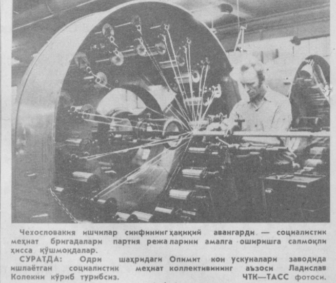
Чехословакия ишчилар синфининг ҳақиқий авангарди — социалистик меҳнат бригадалари партия режаларини амалга оширишга салмоқли ҳисса қўймоқдалар.

САМАРАЛИ ЯНГИЛИК БЕРЛИН. Янги мулти спектрал МСК —4 камерасида «Салют-6» орбитал илмий станциясида ишлатилган МКФ-6—М космик фотокамера билан аэрофото сўйма ишлари учун атайган кўнглида курилма-ларнинг афзалликлари кўрилган. «ГДРдаги «Карл Цейсена» оптик механика комбинатида шундай камералар қўйлаб тайёрлаб чиқарила бошлади. Камера самолётлар ва вертолётларда ўрнатилган атайдилар. Баҳорда Лейпцигга ўтказилган халқаро ярмаркада олтин медалга сазовор бўлган МСК—4 камераси Совет Иттифонининг мутахассисини билан биргаликда яратилди ва синаб кўриди. Бу иш комбинат меҳнаткашлари СССРдаги ҳаммасли билан қилиб келатганлик ариини кўпдан-кўп натижаларидан биттаси, холос.