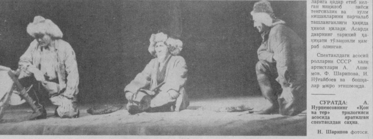
Суратда: А. Нурписовнинг «Қон ва тер» трилогияси асосида яратилган спектаклдан саҳна.

лауреати, театрининг бош режиссери О. Мамбетов томонидан саҳналаштирилган. О. Мамбетов тарихий-иқтисодий, қаҳрамонлик романтик мазмулдаги бадий асар-