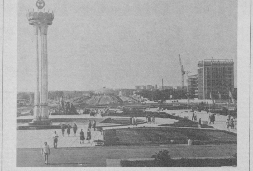
БҮГҮНГИ ТОШКЕНТ. Халқлар дўстлиги майдони шаҳримизнинг энг гузал ва гавжум жойларидан бирига айланиб молди.