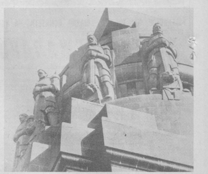
Лейпциг. «Халқлар жанги» шарафига ўрнатилган ёдгорлик фрагменти. (1813 йил).

Социалистик мамиядаларнинг маъшурушу бу ерда 55-мартга ўтказилмоқда. Бу йилги ярмаркада дунянинг 32 мамлакатидан 2.200 фирма қатнашмоқда. Бу ерда 25 давлат ўзининг миллий павильонларини очди.