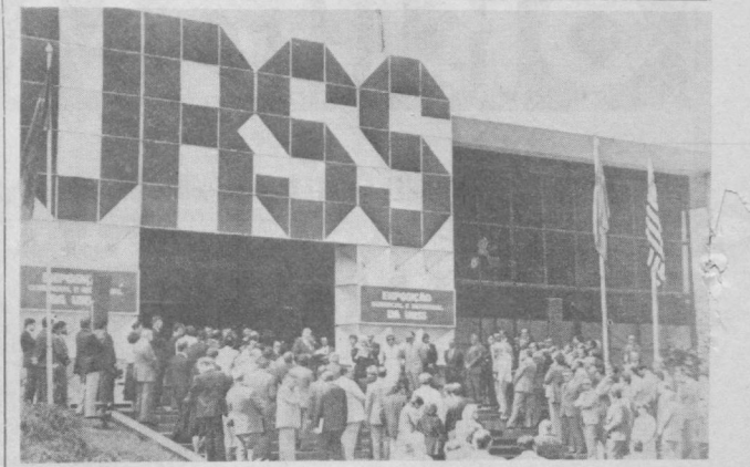
Бразилиянинг йрқик саноат маркази — Сан-Паулула ССРСининг турли соҳаларда эришган муваффақиятларини ҳақида ҳикоя қилувчи савдо-саноат виставкаси катта муваффақият қозонди. СУРАТДА: виставкага кирвершиш жойида.

меҳнат самаласидир. Шунинг учун ҳам ана шу рақамни анча кўпайтиришга кўмаклашишни энг муҳим вазифаларимиздан бири деб ҳисоблаймиз. Шу мақсадда янги, янада самарали маҳсулот турлари ишлаб чиқилибгина қолмай, унинг сифати таъминлаштирилмоқда. А, машина-ускуна ва ларнинг хизмат муддати узайтирилмоқда.