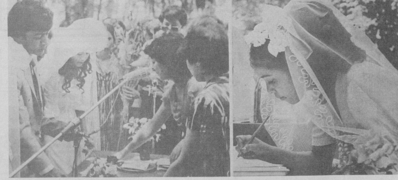
«Ойлангиз бахтли бўлсин, азиз ёшлар!»

жағида пойтахтда янги уй-жойлар, меҳмонхоналар, жамоат ва маданий аҳамиятдаги иншоотлар қурилишини тезроқ бошлаб юбориш зарурлигини айтди. Президент офатга қарши курашда мексикаликлар матонат билан мардона турганликларини таъкидлаб, бу мамлакат жабрдияларининг эҳтижларини учун ҳамон олиб турган халқаро ёрдамга юксак баҳо берди.