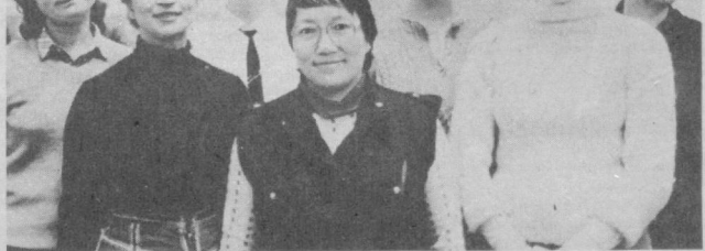
ТОШКЕНТ ТУРНИРИНИНГ ҚИЗҒИН ШАХМАТ МАТЧИ