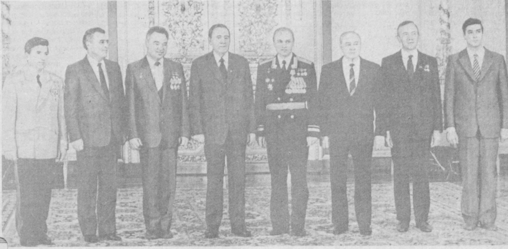
Мукофотларни тошириш пайти.