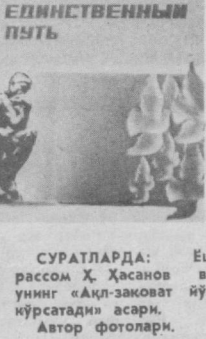
ДОЛЗАРБ КУНЛАР ИЛҲОМИ