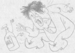
АРАҚХҲУР: Ичаверибман, ичаверибман, умрим увол ўтганини сезмай қолбман.

Халқимиз қалбининг нозик ҳиссиётлари тўқини бўлиш қўшиқлар бебаҳо хазинадир. Мисраларга айланган қанотли орзулар, гўзал ташбеҳларга йўрилган қамалак жиллолар асрлар бўйи тилдан ташмай келди. Улуғ Октябрь инқилоби бахш этган мунаввар ҳаёт халқ қўшиқлари энг мотивлар яратилганига сабаб бўлди. Чечан қўшиқчиларимиз социалистик турмушимизга соя солиб турган ичкиликбозлик, дангасалик, порохўрлик, безорилик каби ярамак иллатларни фош қилувчи ачиқ сатирага бой қўшиқлар тўқидилар. Айниқса, инсон саломатлигини, маънавий қиёфасини хароб қилувчи ярамак одат — ичкиликка ружу қўйиш халқ қўшиқларида қаттиқ қораланади.