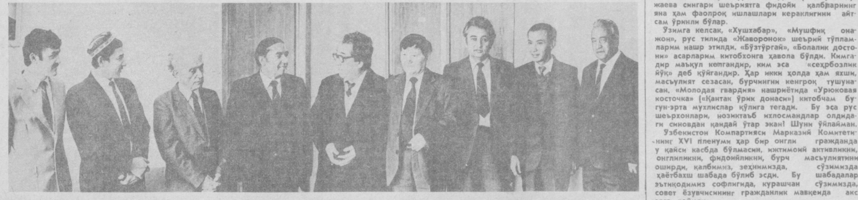
СУРАТДА: суҳбат мавзун — ижодий ёшлар.

қўра, қорани оқ деб ёзишга ҳеч кимнинг ҳаққи йўқ. Ёзувчи халқ дилининг тарихини экан, партиямизнинг энг истеъдодли кўмакчиси экан, у ҳаммага рост ёзиши шарт! Ижодкорнинг граждонлик позицияси энг, изчил бўлсин. Ҳазрат Алишер Навоий бундан 500 йил илгари айтиб қўйган: «Одам эрсанг демакми — одам, анимки — йўқ халқ гондлаи гондлаи». Модомки, партиямиз бизга актив гондла позициясида турганини тайинлаётган экан, биз учун бундан ортиқ ишонч бўлмайди. Ўзбек совет адибларининг кейинги беш йил мавқеида асарларининг жуфта қўлида худди шу позиция, гондлаи баркамоллик билан бадийлик мукаммаллик жон тўқирлик қалам билан, қўшқани айлантиришдан қувонаман. Бир қаламкаш сифатида ўзим ҳам иккита энг хонис ҳакам — Китобхон ва Вақт ҳакамим ил-