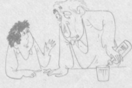
АРАҚХҲУР ОТА: Шунинг ҳам ичмай, эртага албатта дўхтиргиб борман.