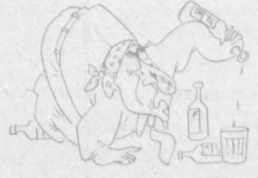
АРАҚ: Бошинг гирр айланган, сезяман. Мен ҳам ичсанг умуман айланмай қўсан.