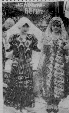
Келинчақлар, қадамингиз кўнтурт келин.

Яқинда Исроилда ўтказилган махсус ижтимоий тадқиқот-сўровлар гаройиб натижаларни берди.