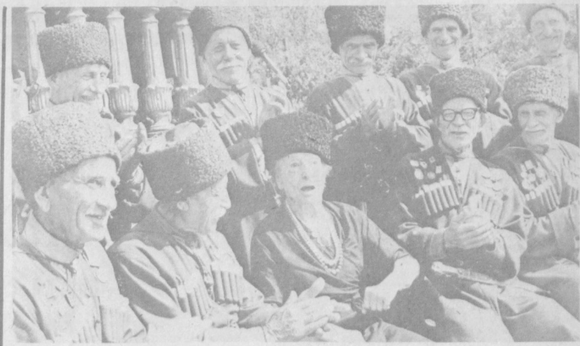
СУРАТДА: пири бадавлат саяхаткорлар.

Бир йилгит ширин хаётини жуда орав қилар ва бу оравнинг амалга ошишини тасодифан келадиган бир бахт туғайди деб билар эди. У ҳеч, бир ишга астойдил киришмас, мақсадга етиш учун меҳнат қилиб тиришмас эди. Илм ўрганишга юраги тор, деҳқончилик қилишга бўйин ёр бермас, кўча-кўйда хор, қўнғилда эса уйланиш истаги барқарор эди. У ўз кенгдошларининг хаётига суқланиб қарар, машаққатларга оғзининг суви келиб ташланар-ди. Аммо дўстлар уни қайси ишга йўллашса, бахти очилсин деб кўнғиллашса, ишга ишдан тезда кетар ва яна дарбадарлик йўлига ўтар эди. У вағма боттада ва умидсизлик юрагига томир отганда қўнғилдаги шеърни хиргойи қиларди: Ҳаётинг на содир йўдошинг бўлса, Ичмоқ, емоқ учун нон-ошинг бўлса. Бир кун қўнғилга барча илмларин жо қилган бир қария у хиргойи қилётган жойдан ўтиб қолди ва унинг хиргойисига қўнғилча қилиб деди. Аммо буғдой орав мувиесар бўлур, Мустваҳкам чидаму, бардошинг бўлса! Бу сўз йилгитнинг юрагига яшиқдек урилди, мақсадга етиш учун чидаму бардош бўлиши зарурлигини аниқлади. У ҳунар ўрганишга киришди ва тез орада мақсадига эришди. М. ҲАСАНОВ тайёрлаган.