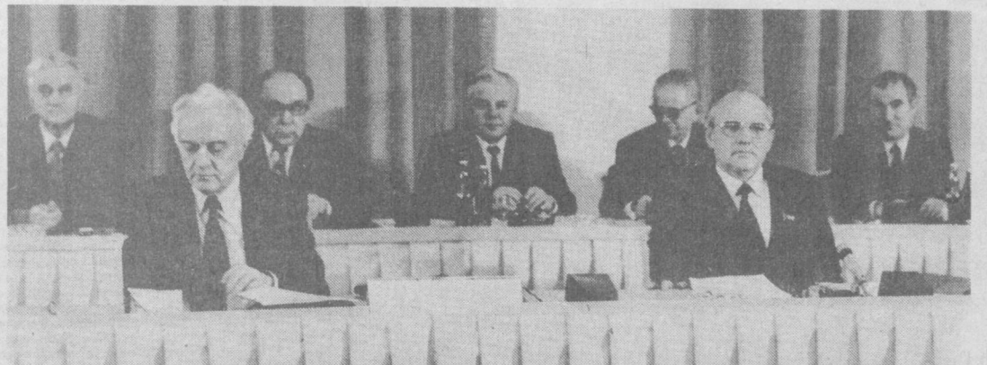
Совет делегацияси учрашув пайтида.

Учрашувда ядро уруши хавфини бартараф этиш, Ерада қуролланиш пойгасини тўғрилик ва шундай пойгачи тўғрилик йўллари излаб топилганлиги тўғрисида 1985 йил январдаги эришилган Совет — Америка ахдомаси тасдиқланганини муҳим аҳамиятга эгадир.