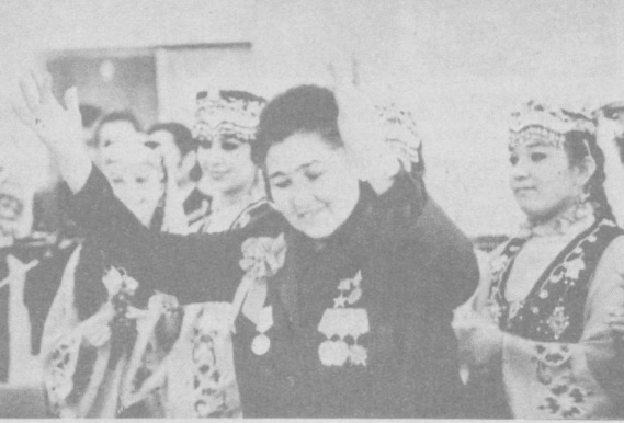
СУРАТЛАРДА: Фрунзе район ҳисобот сайлов партия конференциясида.