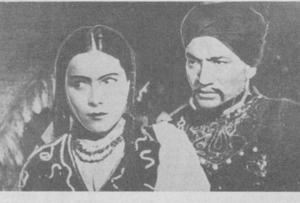
СУРАТДА: Наби Ғаниев яратган «Тоҳир ва Зухра» фильмдан кадр.

Мен биринчи нав-бадам Наби Ғаниевнинг режиссёрлик маҳорати ҳақида гапирмоқчимэн. Бу маҳорат республика-да ўзбек киносини ву-жудга келтиришдек ша-рафли масъулият, су-ронли дэврлар билан чамбарчас боғлиқдир. Наби Ғаниев давр во-қеалари, ижтимоий ҳа-дисалар оловида тоб-ланди. Унинг ижодий мақсад-интилишлари хал-қимиз, она-Ватанимиз-нинг истиқбол сари ша-ҳадат одимлар билан ҳамон одимлари билан Шунинг ҳақида гапирмоқчимэн. Бу маҳорат республика-да ўзбек киносини ву-жудга келтиришдек ша-рафли масъулият, су-ронли дэврлар билан чамбарчас боғлиқдир.