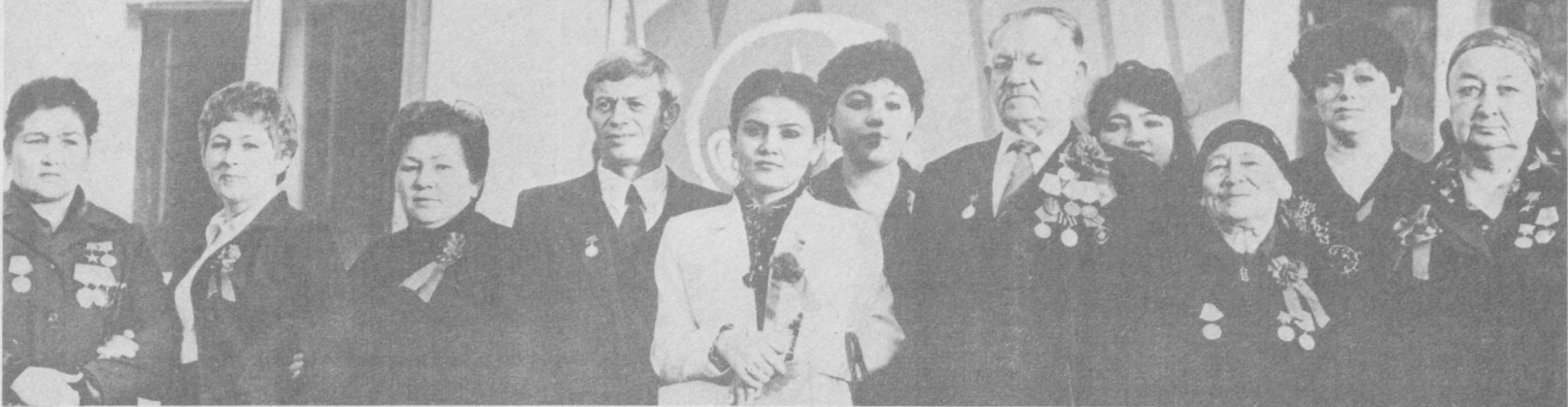
СУРАТДА: Фрунзе район ҳисобот-сайлов партия конференциясининг бир группа делегатлари.

Фрунзе район ҳисобот-сайлов партия конференциясидан