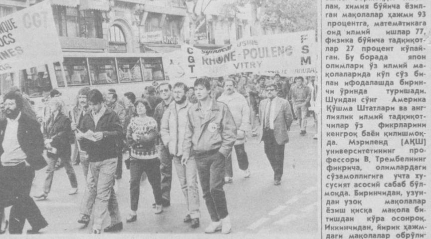
Франция. Париждаги умумехнат конфедерацияси қачирғига биноан мамлакат ҳокимиятининг ҳозирги кунда олиб бoрилаётган сийбетага қарши кўп кишилик митинг бўлиб ўтди. Митинг қатнашчилари оммавий ишчиларга қарши, ҳаёт кеңириши нинг оғирлиги, меҳнаткашлирини ҳуқуқ ва озодлиги бузилаётганлигига қарши норозилик билдиришти. СУРАТДА: митинг қатнашчилари.

ЖОРЖТАУН. Кариб денгизидеги орол давлат Сент-Селенте ва Гренадада апертеид сийбетага қарши кураш билан бирдамлик комитети тузилди. Мамлакатнинг қариб 50 та касаба союз ташкилотлари шу комитетнинг коллектив аъзолари бўлиб қолди. Комитет Жанубий Африка ва Намибиядаги аҳвол, бу мамлакатлар халқларининг Преториядаги ирқчи режимига қарши кураши тўғрисида ҳаққоний хабарлар тарқатишига ёрдам бериш, Жанубий африкалик ватанпарварларга ёрдам фондида маблағ тўплаш ўз олдига вазифа қилиб қўяди.