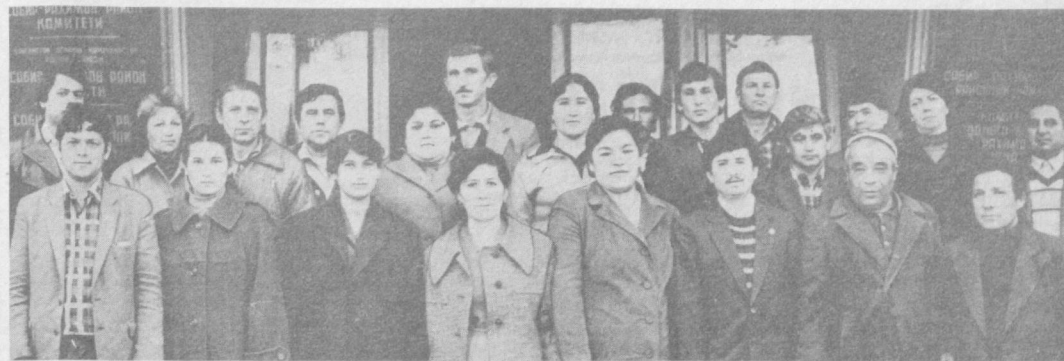
Собир Раҳимов райони: