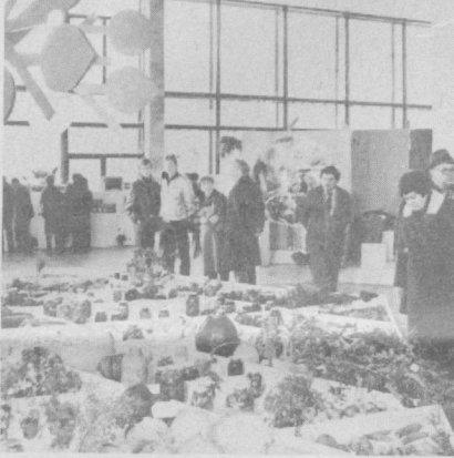
СССР Халқ Хўжалиги Ютуқлари Кўргазмасининг «Богдорчилик, узумчилик ва субтропик экинлари» павилонидан томоркаларга ишлов берилганда қўлланиладиган асбоб-ускуналар кўргазмас шимшиқон қотишмаларида яратилган.