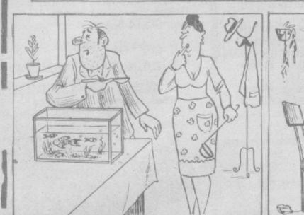
Ичкиликбоз эр: — Балқил шўрваннинг тузини пест қилибсан хотин.

Мехнат бизнинг замонда буюқ ҳуқуқ ва буюқ бурчдир. В. ГИГО. Одамлар учун ҳақиқий хаёлини — меҳнат қила билишдир.