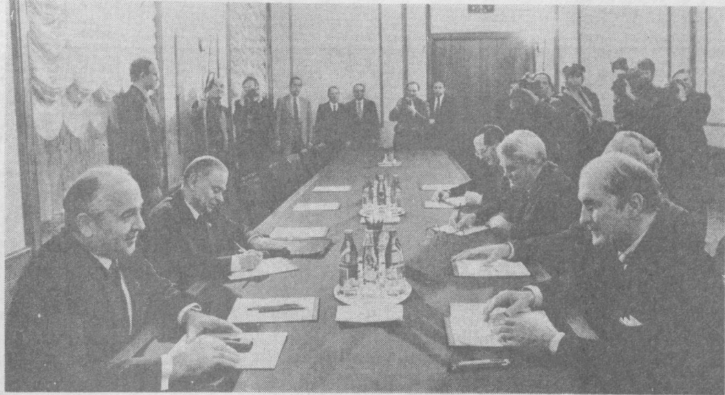
Суратда: суҳбат пайти.

10 декабрь куни КПСС Марказий Комитетининг Бош секретари М. С. Горбачев Америка—Совет савдо-иқтисодий кенгашининг IX йиллик йиғилишида қатнашиш учун Москвага келган АҚШ савдо министри М. Болдрики Кремлда қабул қилиб, у билан суҳбатлашди.