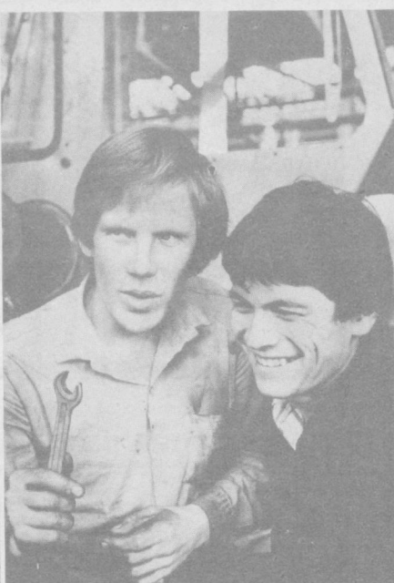
Беш йиллик вахтасида

Дарҳақиқат, заводдаги илгор бригадалар фаолиятини таҳлил қилиш ҳам бригада усули ишлаб чиқариши юксалтириш, маҳсулот сифатини тайимай яхшилаш борасида улкан имкониятларни юзга келтиришдан далолат беради. Бу имкониятлардан фойдаланиш мажбуриятини коллективга янги беш йиллик олдинга қўйилган вазиёларини муваффақиятли бажариш, пахтакорларга янада сифатли ва мустаҳкам техника воситалари етказиб беришда қўй келади.