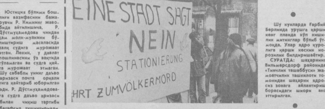
Шу кунларда Фарбий Берлинда урушга қарши кенг панада кўп кишилик митинглар бўлиб ўтмоқда. Улар ядро қурулига қарши кескин нозрозлик билдиришяптир. СУРАТДА: шаҳарнинг Вильмерсдорф районда «Тинчлик ташаббуси» жамоатчилиги ташкилотни томонидан шаҳарни ядро-сиз зонага айлантириш борасидаги ишори акс эттирилган.

ДЕХЛИ. Агар Покистон атом бомбасига эга бўлган тақдирда эга Ҳиндистон ўз атом бомбасини яратиш ниятида эмас. Республика ўзи учун энг муҳим аҳамиятта эга бўлган ўз мудофаа манфаатларини таъминламоқ учун ҳеч қандай қишлоқчиликларга бермайди. Парламентдаги мунозаралар чоғида таши ишлар министри Б. Р. Бхагат шу тани айтди. «Биз ҳаммиса Ҳиндистоннинг ядро программасини тинчлик мақсадида қўлайди, деб таъкидлаб келдик. ҳар қалай республика ядро портлауларини амалга ошириш техно-логийасига ҳам эъру қиришди. Покистон ўз ядро қурулини яратётганлиги ҳақидаги муайян факт-