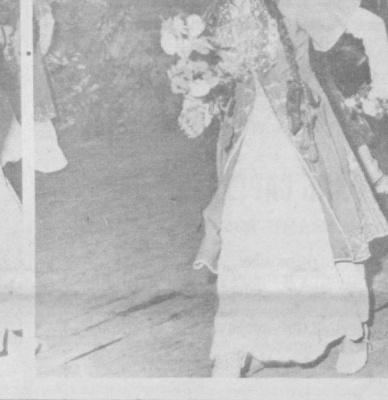
СУРАТЛАРДА: халқ рақс санъати анжумани қатнашчилари саҳнада.