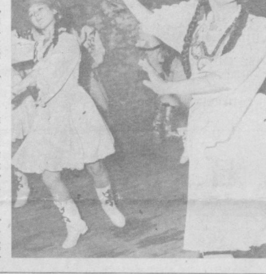
Семинар-кенгашнинг дастлабки куниде «Анджон полкиси» халқ ашула ва рақс ансамбли қатнашчилари намойиши қилган концерт программаси мехмонларга мақсуд бўлди. Бундай бадиий чиқишлар давом эттирилиб республикамиз ва ит етук ижодий коллективлари ҳам ўз санъатлариини намойиш этдилар.

Ушбу анжуман беш кун давом этди, унда халқ рақс санъатига музикалар яратилиши жараёни, ҳаваскорлик рақс тўғрисидаги саҳна кийимлари намойиши қилинди.